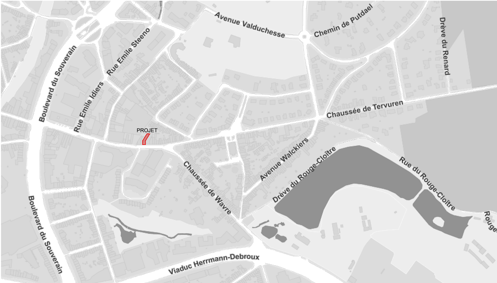
PLAN DE SITUATION 1/5000